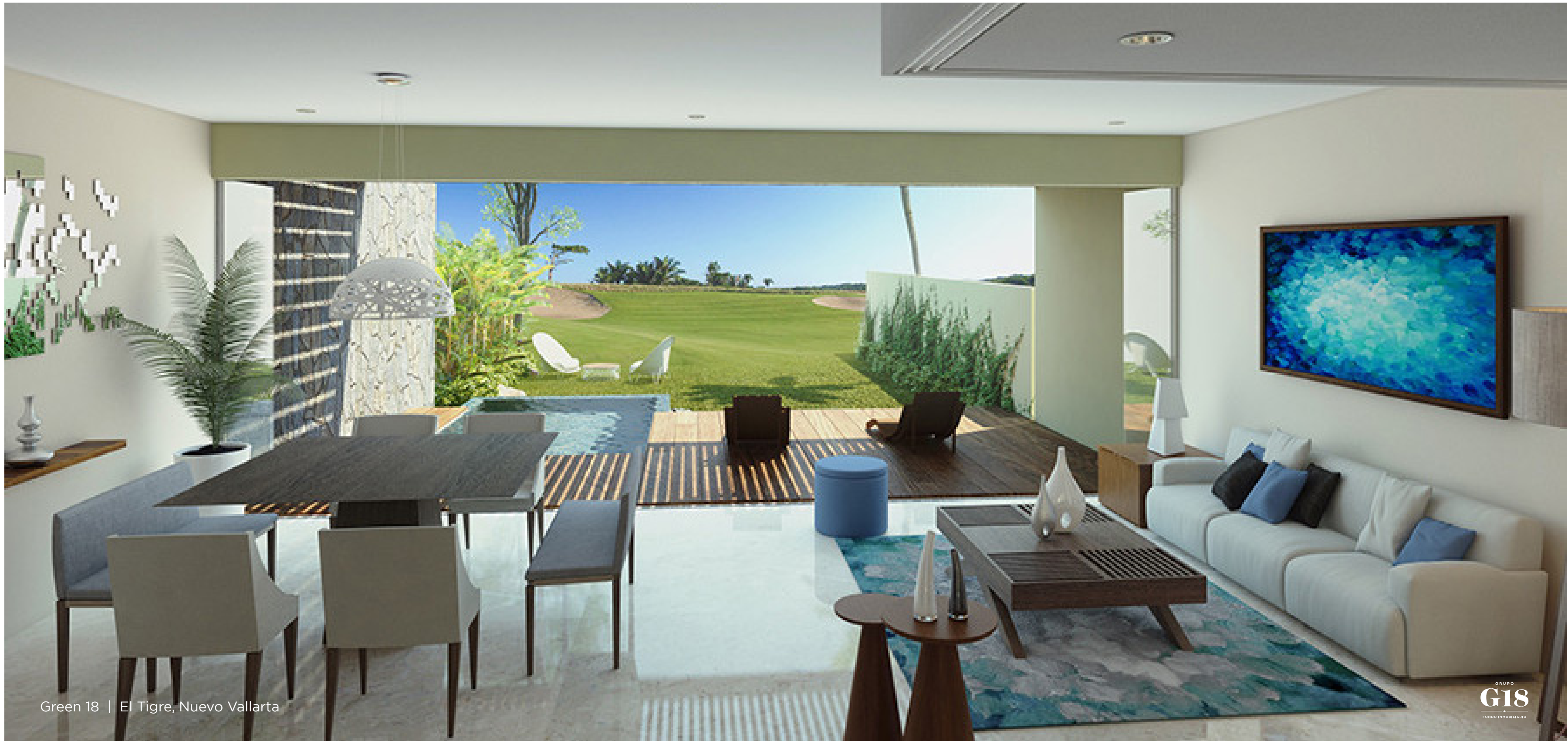
Green 18 | El Tigre, Nuevo Vallarta