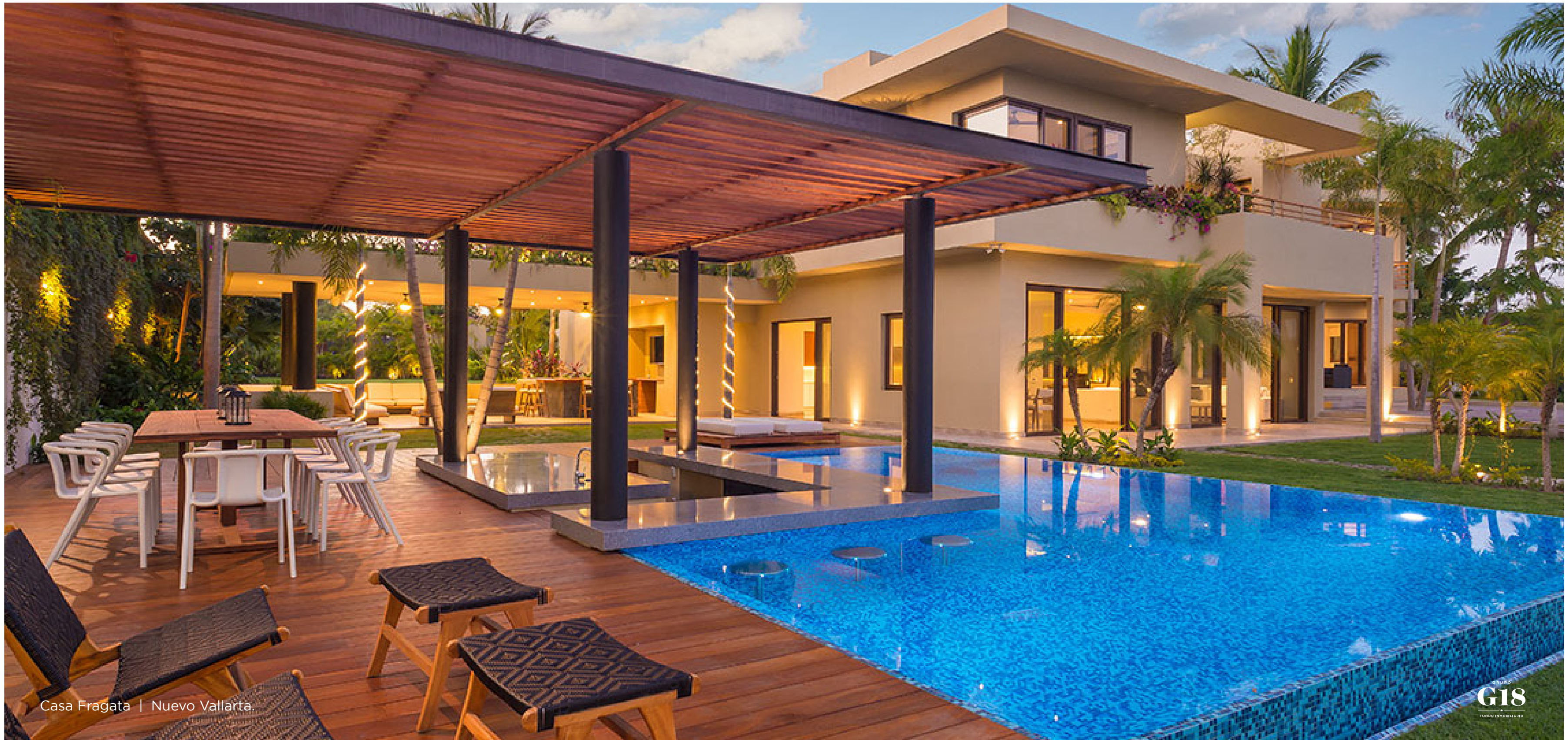
Casa Fragata | Nuevo Vallarta.