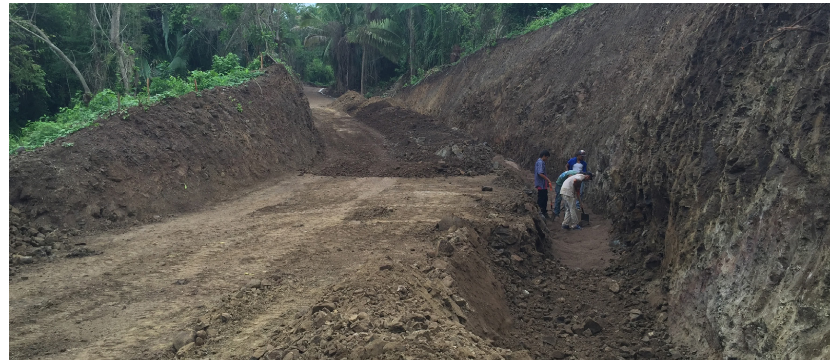
◆ LA MANDARINA 3 vialidades con muro de contención de piedra natural.