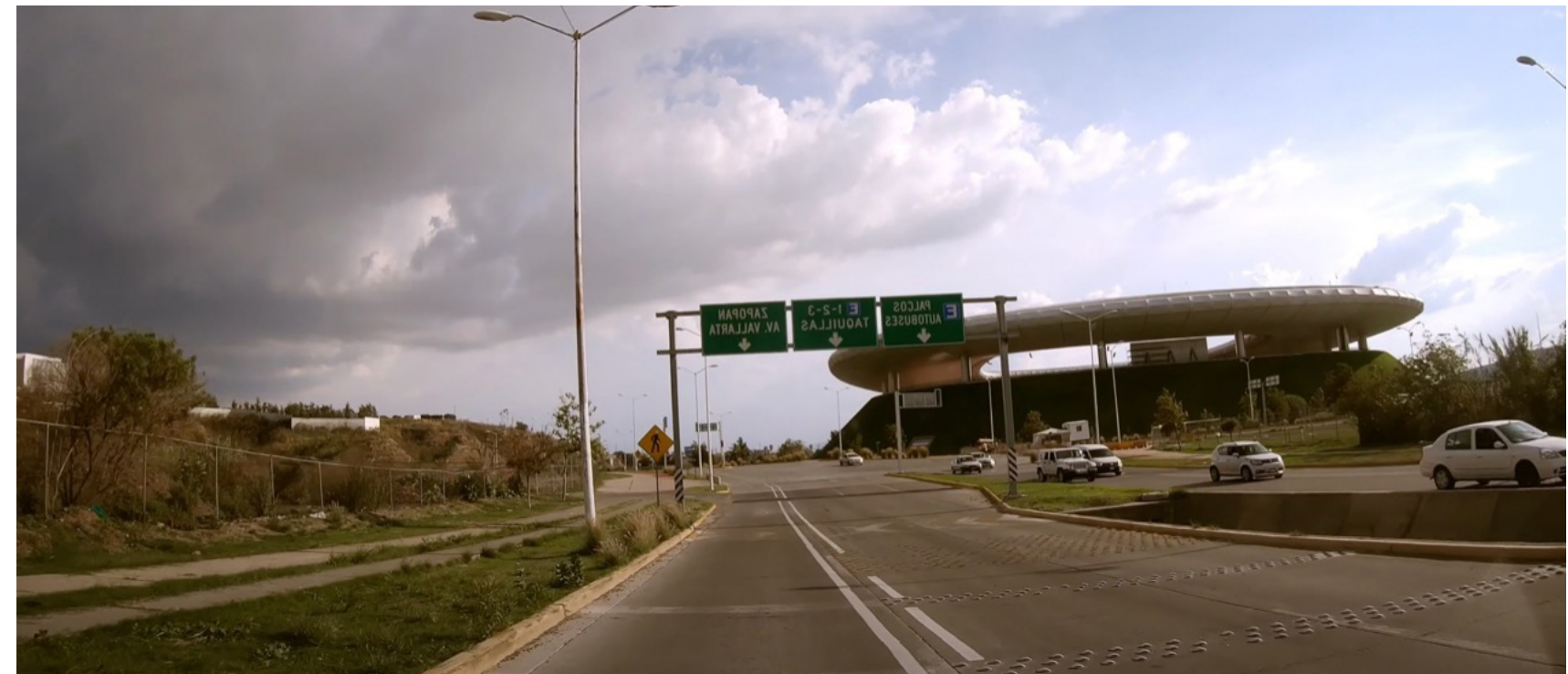
◆ ENTRADA AL ESTADIO AKRON