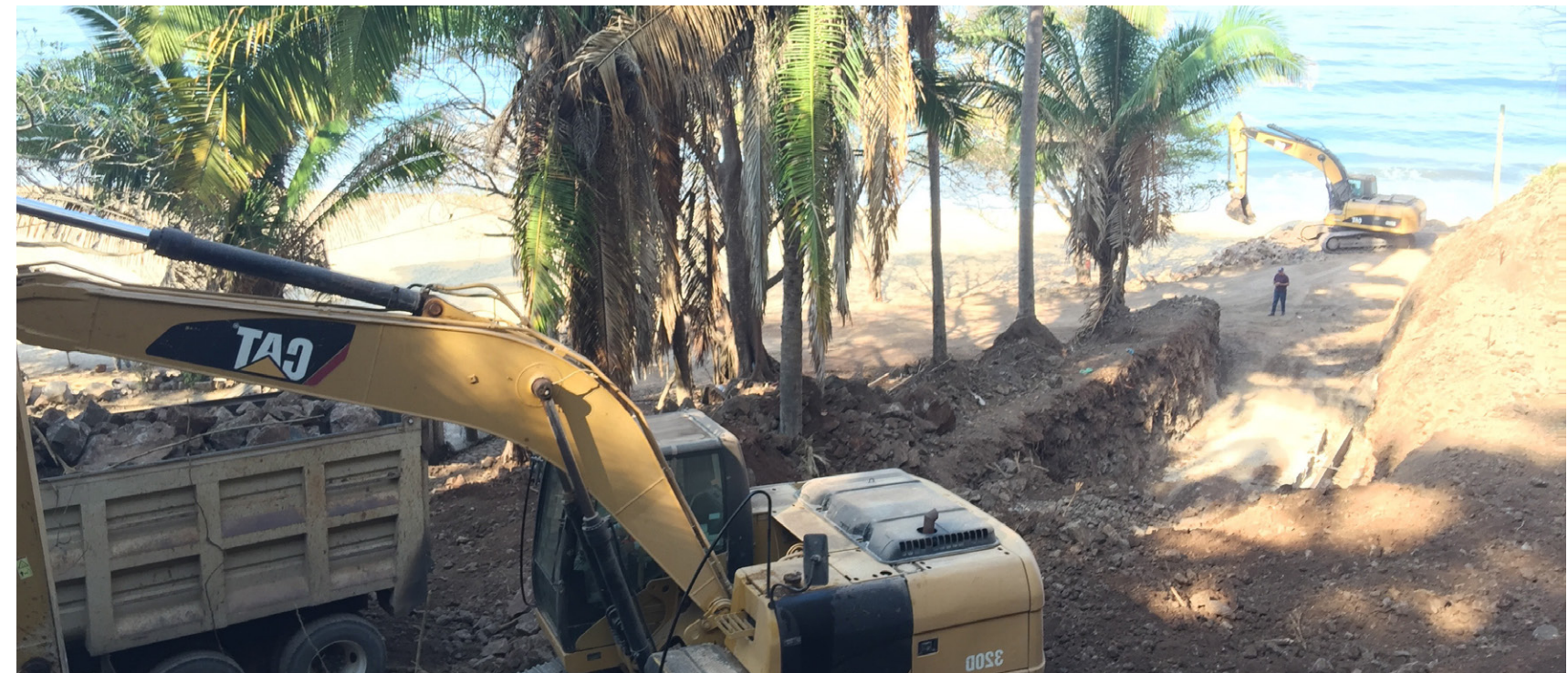
◆ LA MANDARINA 3 vialidades con muro de contención armado de concreto